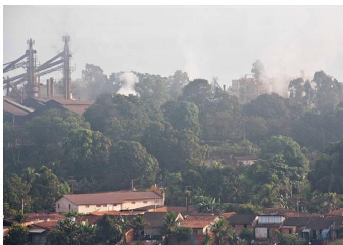
Foto 1. Comunidade, siderúrgica e poluição.

Piquiá de baixo conta com 320 famílias (mais de mil pessoas) que residem neste, sendo circundado por cinco indústrias de ferro-gusa e Estrada de Ferro Carajás.